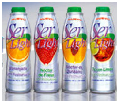
Figura 11. Envases con etiquetas termoencogibles.

La etiqueta encogible de cobertura total en botellas de una sola porción provee un mayor y más poderoso espacio publicitario para atraer a los consumidores (figura 11). Estas etiquetas también pueden ser usadas para cubrir totalmente empaques con formas únicas, que poseen demanda de consumidores que buscan envases mejorados ergonómicamente.