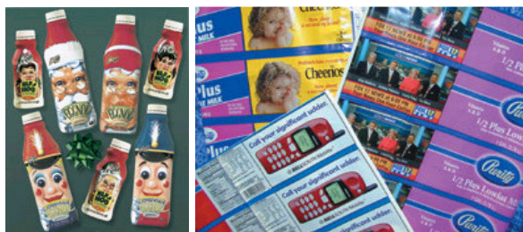
Figura 8. Ejemplo de promoción navideña (izquierda) y etiquetas estirables con cupones de productos (derecha).

Una compañía ubicada en Ohio aprovecha sus etiquetas para conectarse con los consumidores. En Navidad la compañía ofrecía una línea de botellas coleccionables (figura 8) que incluían diversos personajes alusivos a la festividad.