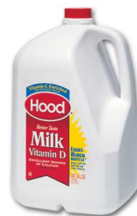
Figura 2. Ejemplo de envases soplados de PEAD usados para empaque la leche.

El empaque comercial de la leche apareció después de 1884, cuando la botella de vidrio de leche fue inventada por el Dr. Hervey D. Thatcher en Potsdam, N.Y. Los envases de vidrio fueron reemplazados por envases de cartón plasti-cubierto y éstos a su vez por botellas fabricadas con PEAD, que fueron introducidas al mercado en 1932 y 1964 respectivamente. (2)