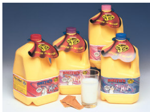
Figura 4. Ejemplo de una empresa que usa su etiqueta para explicar los beneficios de su contenedor amarillo.

Casi cualquier color es posible, pero el amarillo y el blanco son dominantes para las aplicaciones de leche líquida. Los consumidores prefieren el color blanco ya que representa de una manera más precisa el contenido del empaque. Sin embargo, se han introducido en el mercado nuevos empaques amarillos, que con un adecuado mercadeo han logrado subir las ventas. En la figura 4 se presenta el nuevo empaque desarrollado por una empresa americana que, para introducir al mercado su producto envasado en botellas amarillas, usó sus etiquetas para educar a los consumidores sobre los beneficios del nuevo contenedor (4) .