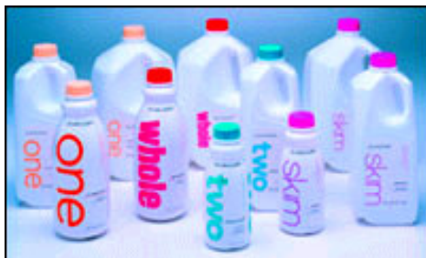
Figura 5. Una empresa utiliza botellas de PEAD para dar una nueva imagen a su producto.

coloca en inventario. Estas características son ideales para los empaques de leche, y pueden lograrse a través de diversas tecnologías incluyendo procesamiento aséptico, ultra-pasteurización, microfiltración, entre otras. (7)