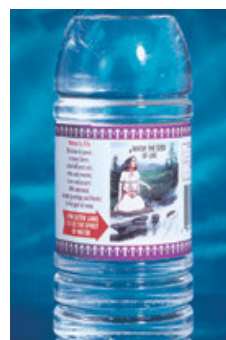
Figura 10. Ejemplo de las nuevas etiquetas giratorias, que ofrecen un 75% más de espacio publicitario.

Este tipo de etiqueta provee hasta un 75% más de espacio para información de la marca, educación nutricional, lenguajes múltiples, letras de mayor tamaño para consumidores de mayor edad, promociones especiales y mercadeo ocasional.