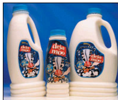
Figura 6. Nuevo diseño de envase para leche.

Este tipo de empaque le da una razón a los consumidores para comprar el producto.