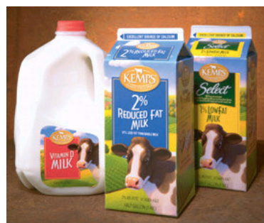
Figura 9. Ejemplo de nueva etiqueta sensible a la presión, más llamativa para el consumidor.

Históricamente, las etiquetas aplicadas con adhesivos o aquellas sensibles a la presión han sido usadas en jarrones de leche y las envoltentes o "wrap around" en botellas. Este tipo de etiqueta no es de gran ayuda para el mercadeo de la leche debido a su limitado espacio; sin embargo, algunas empresas (figura 9) han utilizado satisfactoriamente etiquetas llamativas para promocionar su producto.