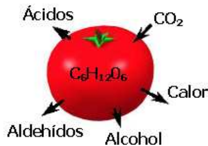
Figura 2. Respiración Anaerobia.

Cuando un vegetal es empacado al vacío (con menos del 2% de O_2 ) éste convierte los azúcares almacenados en energía por medio de un camino glicólico (Figura 2) ya que no hay suficiente O_2 como para hacerlo vía ciclo de Krebs. Esta reacción fermentativa genera productos como alcoholes, aldehídos y ácidos orgánicos, que son responsables de olores y sabores indeseables en el producto, y que trae como consecuencia una menor frescura, a pesar de que el vegetal no suele tornarse marrón [5].